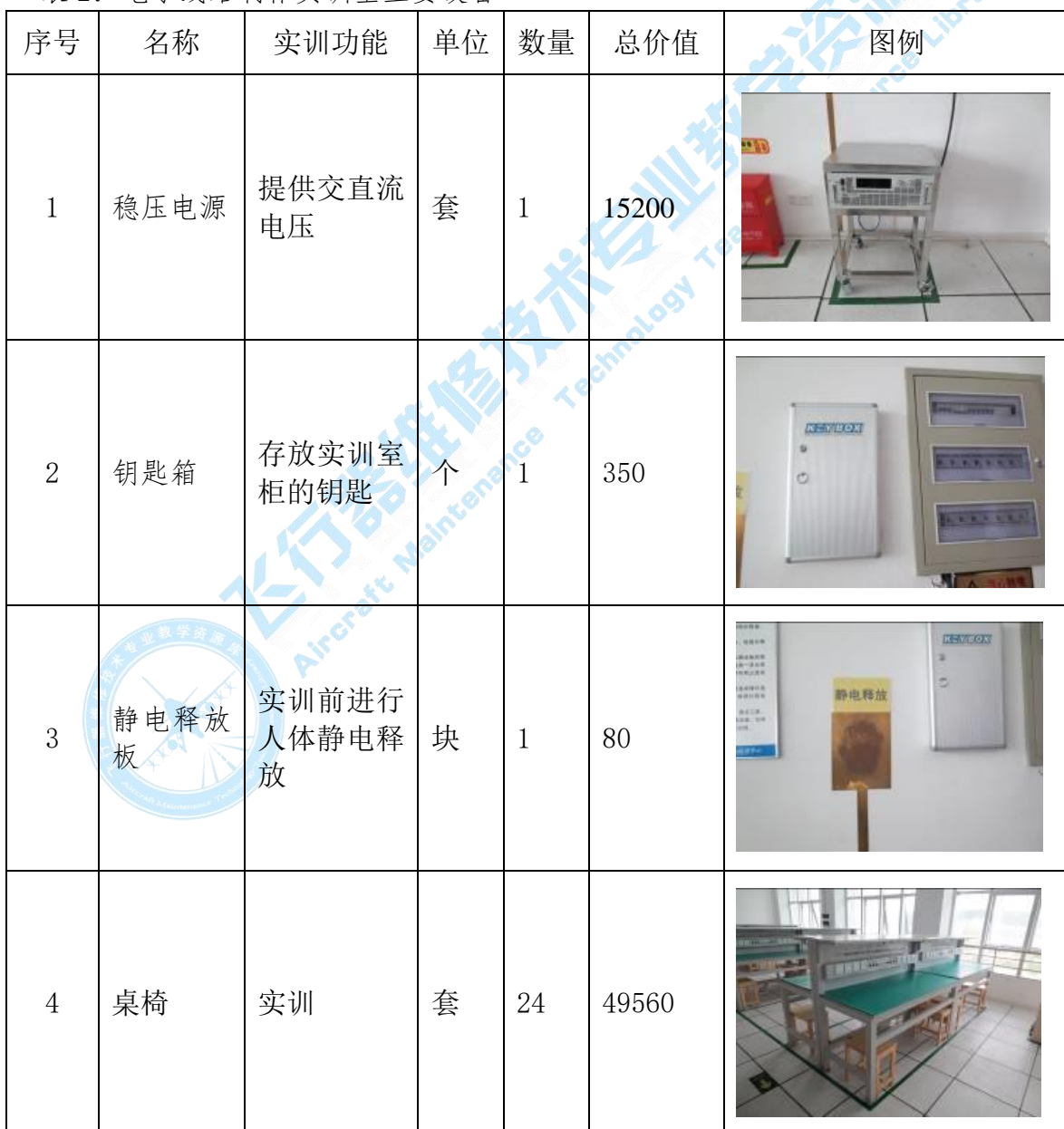
表 2：电子线路制作实训室主要设备